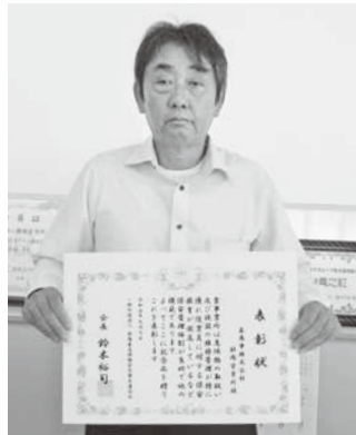
《優良事業所》 森商事株式会社 静岡営業所 様