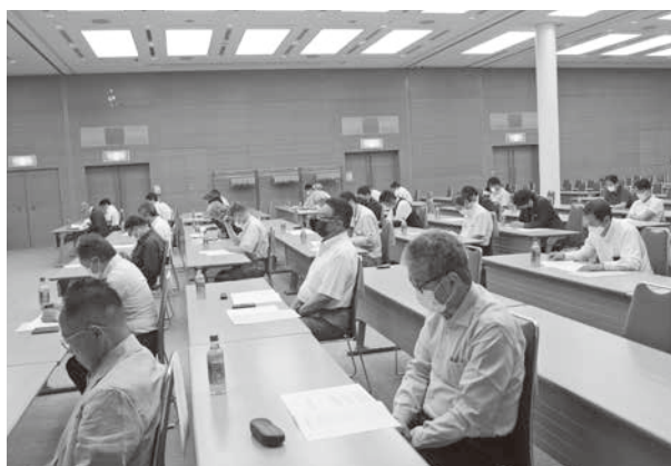
第1回理事会 総会提出議案を審議