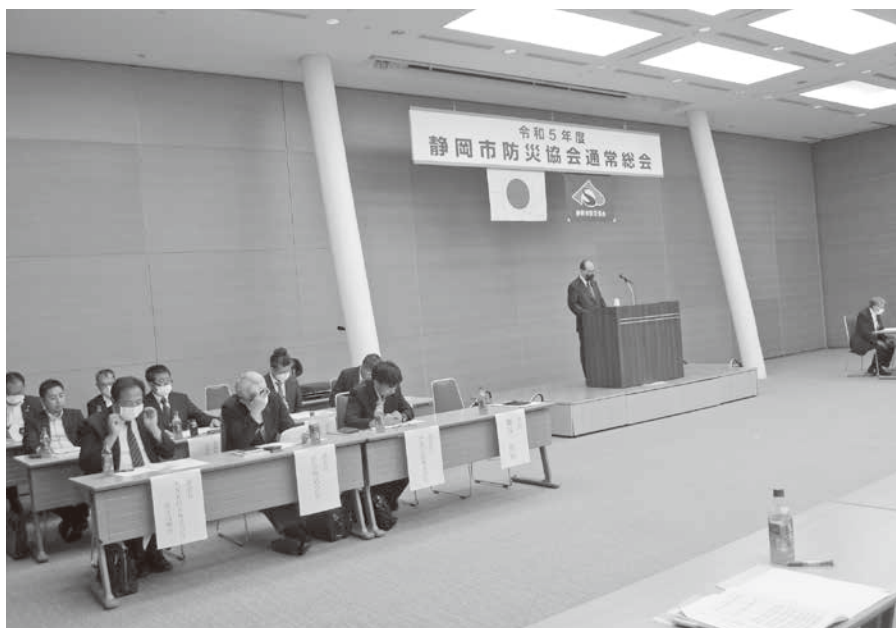
令和5年6月19日 グランシップにおいて開催 事業計画案、予算案等 提出議案を承認